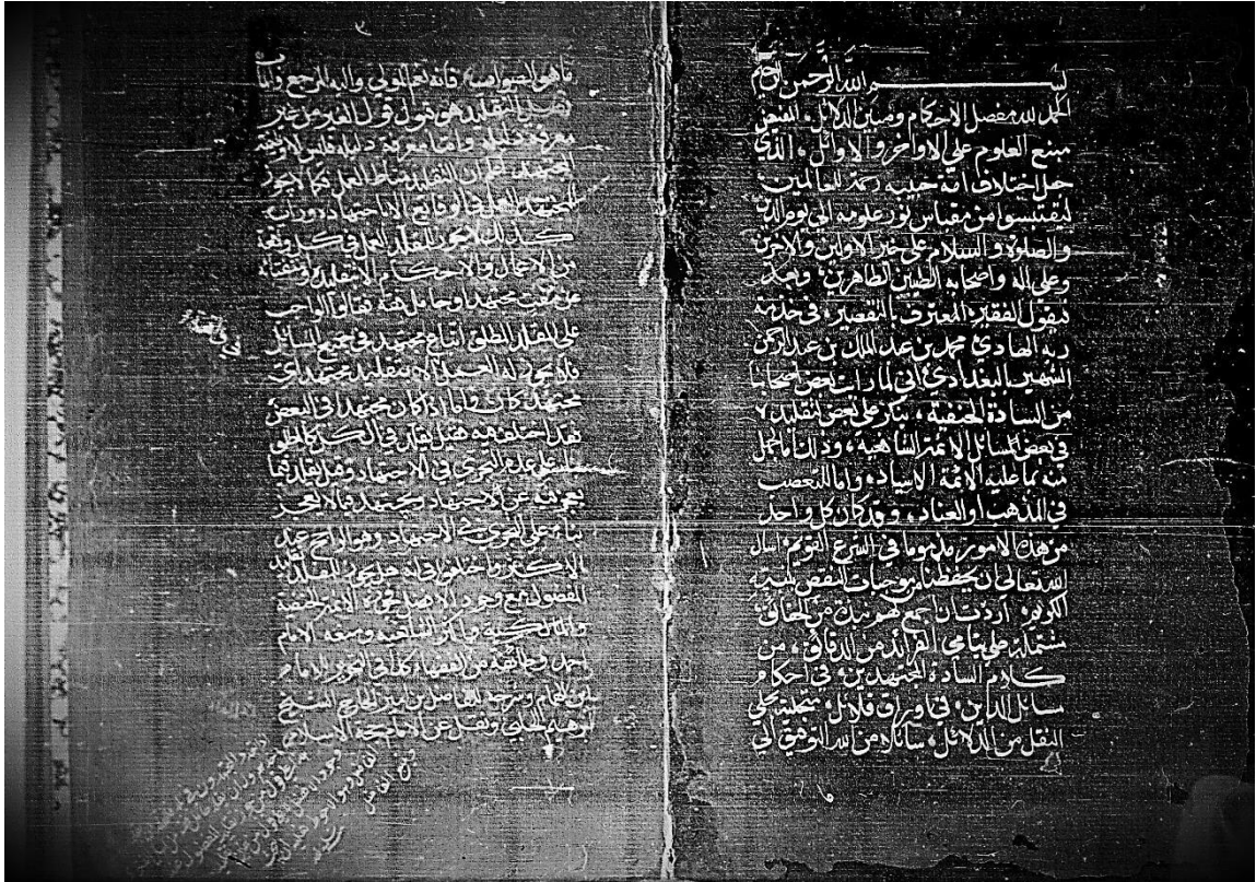
الصفحة الأخيرة من النسخة (ر)